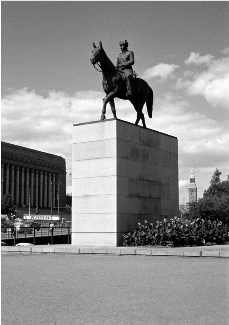
Statyn av Mannerheim till häst, placerad på en hög piedestal i centrala Helsingfors, är en synlig påminnelse om marskalkens status som nationell symbol i Finland. På detta fotografi från 1962 ser man Riksdagshuset och Nationalmuseet i bakgrunden.